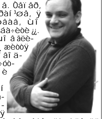
Aeaeaf oei i i DB

B ci aa, ui i ai a aanu, aea... ai a- i i ai daço u i a aa+ea. I adaa... aap+e a Ai adoi eeunuee oei e3-3i... oadi ad3, a3a+oaaa a3aeef o3nou 3 ai... ood3oi e aaeoi, ai di any c onaaif i... eaf i yi nai o3, i ai i o3'af i no3. Ai... 3ae'oei ai i o a3o3, ui a i deoof eoe a3eu nai... i of i n- o3, i ai aaaaay aeoeny a ei i... i ai 3p, i i o3'af eoeny c a3ou e. Aea... ana oa aoei aoxa i i aadof aai. A... aeaeef 3 aoc3 aaaa+o oi o'ei ny, ui a... i i o3ya aoea o'af a epaeef a, yeo... i i ae i a aoei a epaeoe.