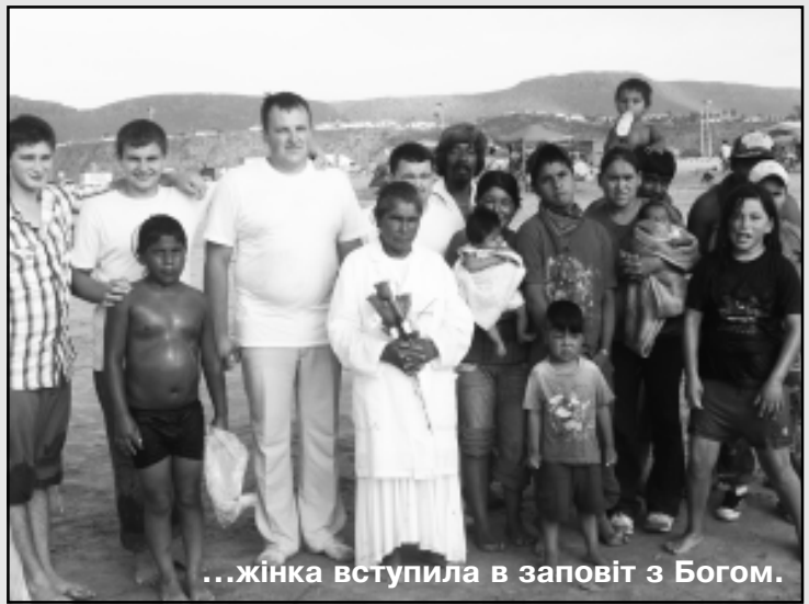
...жінка вступила в заповіт з Богом.

Жінка зраділа, а ми розпочали їй розказувати про Бога, вона сказала, що її мама вірує і вона дуже хоче