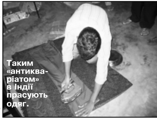
Таким «антикваріатом» в Індії прасують одяг.

зі своїх схованок, щоб побачити, які ж вони, білі люди. Торкнувшись нашої руки для них було дивиною. Ми для них чужоземці із незнамого Заходу. Слухаючи проповідь під відкритим