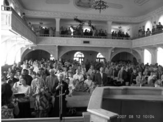
Дім Молитви у м. Ковель (Волинська обл.)